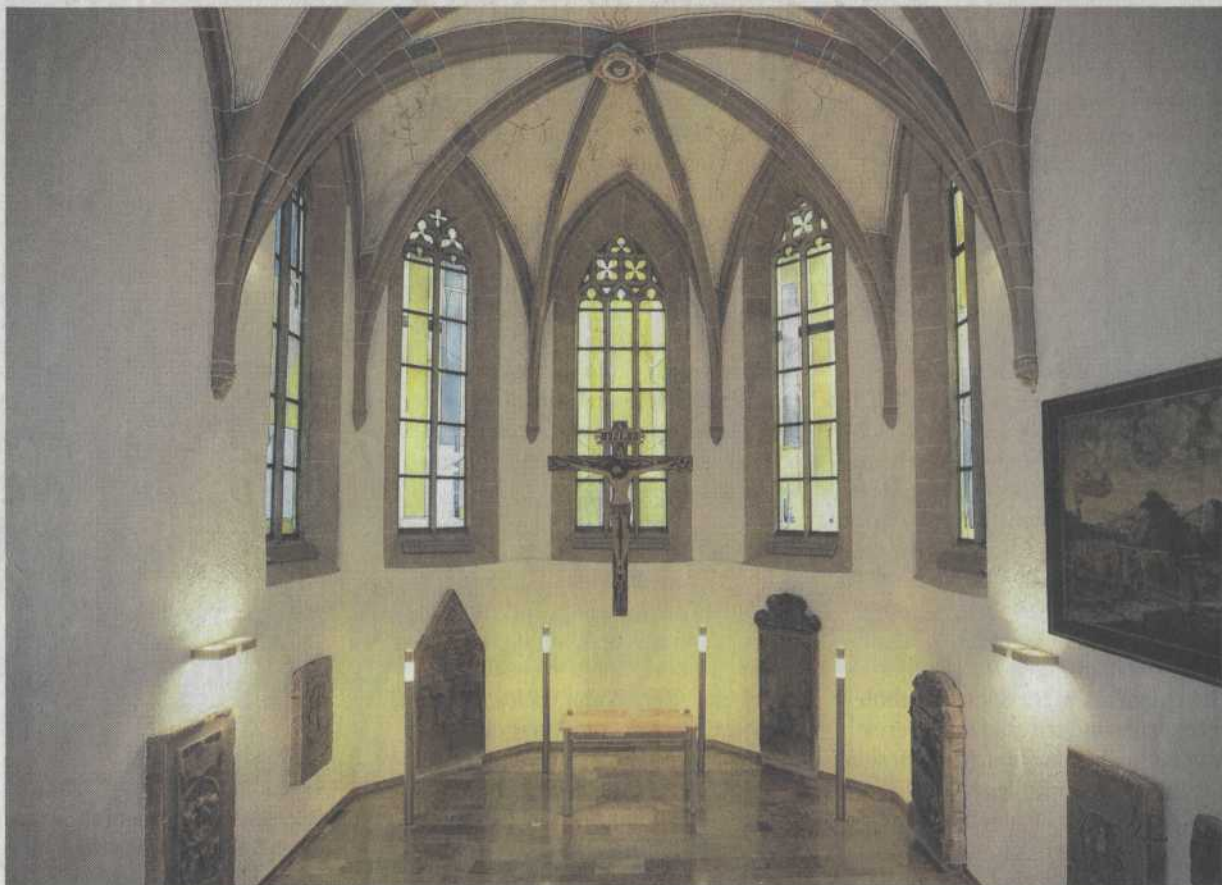
Fünf der sieben neuen sakralen Fenster umgeben das Kreuzifix mit dem leidenden Christus im Ostchor der evangelischen Kirche in Weinsberg. Die Kunst von Professor Johannes Schreiter besticht durch die Wirkung des Lichts.